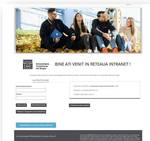
Pagina de logare la Intranet – captură